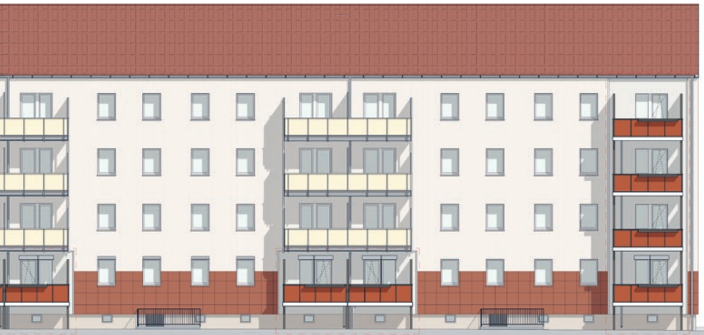
Balkonanbau Fontanestraße 13 - 17

lennachprüfungen. Weiterhin erneuern wir auch Schließanlagen (Ersatz für Lohmann-Schlüssel).