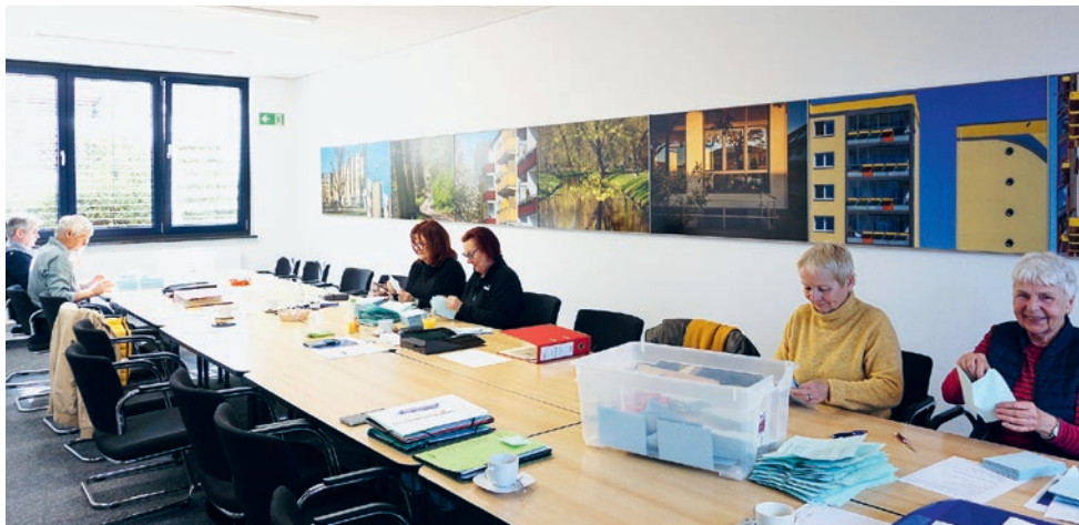
Auszählung der Stimmen am 17. März in unserer Geschäftsstelle