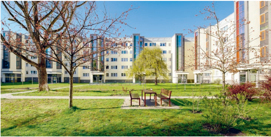
Innenhof Walter-Friedrich-Straße 19 - 37