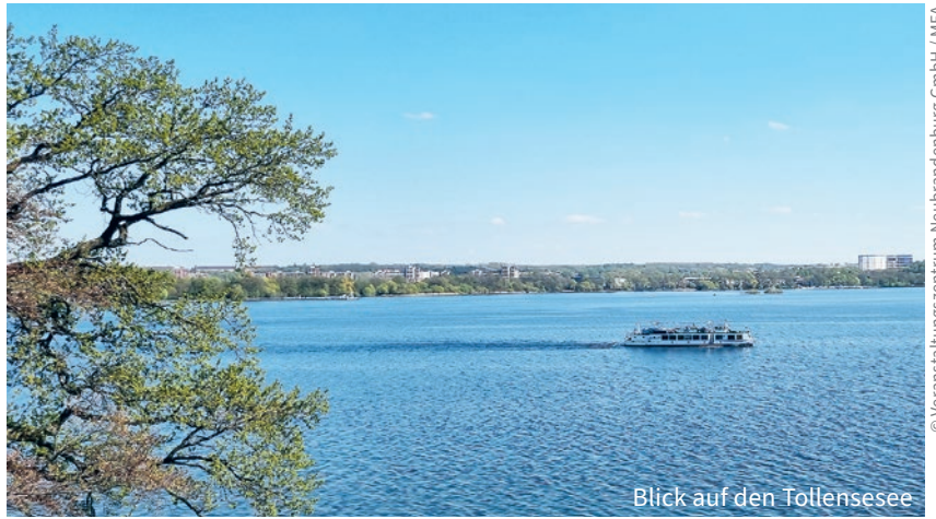
Blick auf den Tollensesee